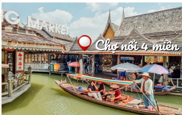
Chợ nổi 4 miền